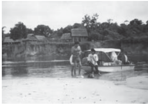
Caño Bocón, Afluente del Río Inirida en el Guainía, Colombia. Al fondo un caserío indígena. En invierno las aguas llegan hasta los pilotes de los ranchos.