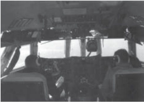
Cabina de mando del IL-76, al poco tiempo de despegar de Ammán, Febrero 1999. Posteriormente esta operación fue abortada por mí en Trinidad y Tobago. Los pilotos rusos tenían instrucciones de llegar a Iquitos, Perú, sin ninguna operación intermedia.