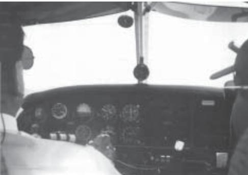
En un vuelo de entrenamiento listo a cruzar la Cordillera de los Andes en un avión PA28, en 1994, por el NDB EPO, El Paso. A la derecha mi instructor de vuelo, ex coronel de la Fuerza Aérea Colombiana, quien había sido el piloto del C-47 que me llevó a Villavicencio cuando estaba yo prestando servicio militar en las selvas del Vichada.