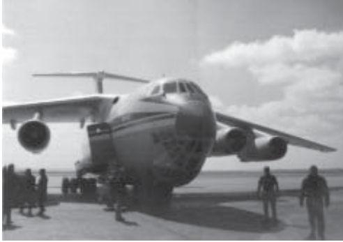
El IL-76, avión ruso de transporte militar de medio alcance. Producido por Ilyushin Aviation Complex Joint Stock Company en Moscú. Máximo peso de despegue 170 toneladas y 47 toneladas como máximo de carga. Tiene una autonomía de 6.100 Kilómetros con 20 toneladas de carga y de 3.000 Kms con 47 toneladas. Aterriza en 800 metros aproximadamente. Ammán Febrero 1999.